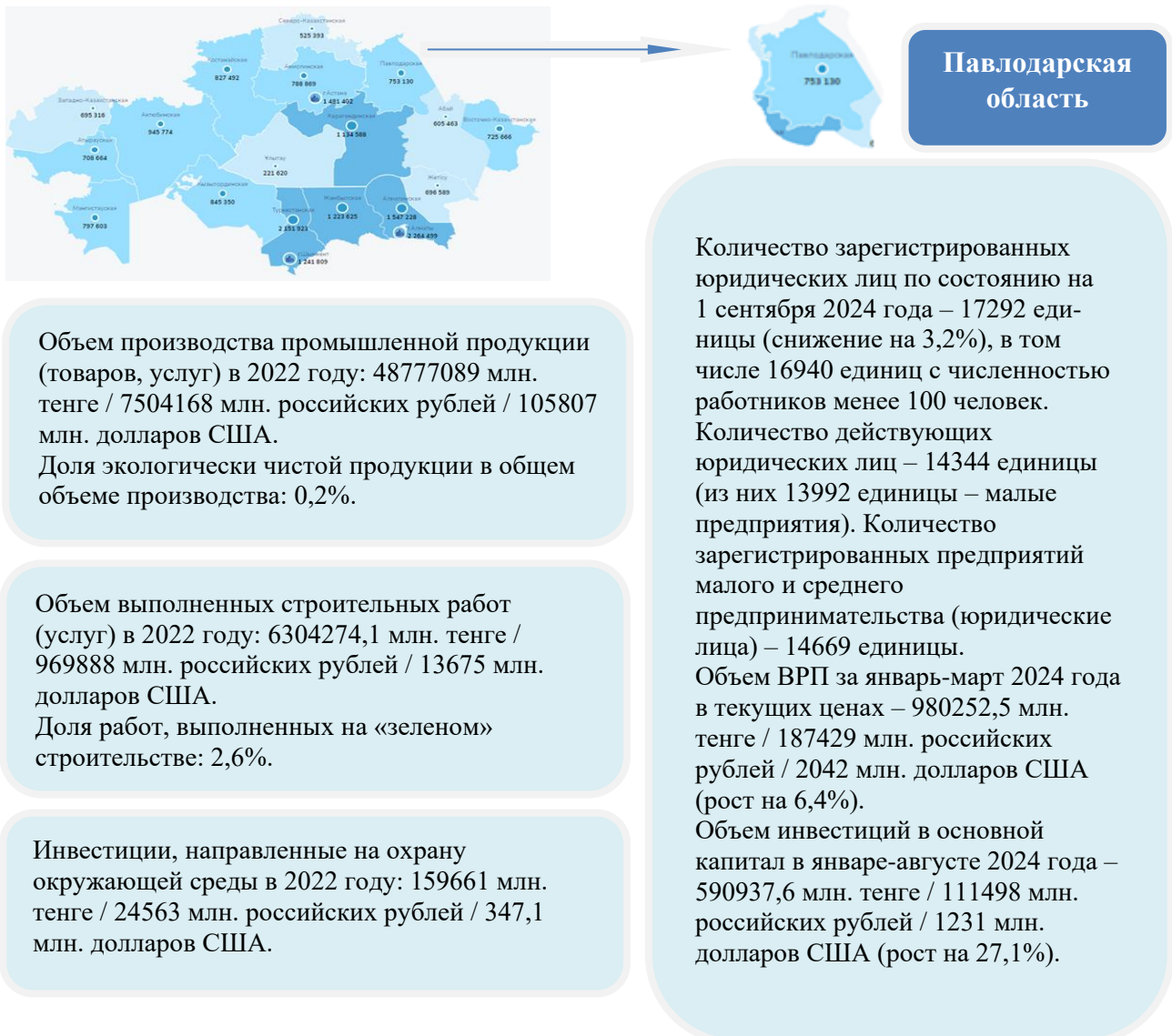
Рисунок 1 – Эколого-экономические показатели развития Павлодарской области и Республики Казахстан [3]

Оперативная статистика социально-экономического развития Павлодарской области за январь-июль 2024 года свидетельствует об увеличении взаимной торговли со странами ЕАЭС по сравнению с январем-июлем 2023 года. В частности, объем взаимной торговли достиг отметки 976,6 млн долларов США (рост на 5,7%), включая экспорт в объеме 513,1 млн. долларов США (рост на 7,1%) и импорт в объеме 463,5 млн. долларов США (рост на 4,2%). На рисунке 1 представлен современный эколого-экономический портрет региона и страны.