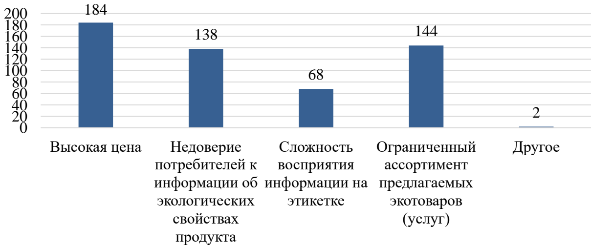
Рисунок 4 – Результаты ответа на вопрос «Какие барьеры имеются в приобретении и использовании экологических товаров (услуг)? (выбрать несколько вариантов ответа)», количество ответов

разуя на региональном уровне научно-технологические кластеры, а также способствует повышению инновационной активности в целом среди населения, формирует предпосылки для экологического восприятия действительности.