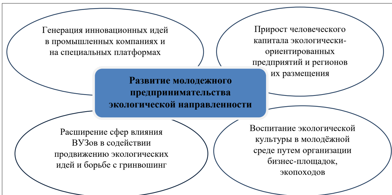
Рисунок 2 – Области развития молодежного предпринимательского движения экологической направленности

С целью развития циркулярной экономики промышленные компании внедряют экологические инновации, основным источником инвестиций которых являются специальные фонды внутри интегрированных хозяйственных структур. В частности, металлургическая корпорация «Eurasian Resources Group» (ERG, Казахстан) запустила Программу по снижению выбросов твердых частиц на 56%, сокращению объемов водопотребления на 33%, снижению сбросов загрязняющих веществ на 30%. Реализация проекта «PeaERG Recycling» позволит довести уровень переработки и реализации вторичных материалов, полученных из отходов производства до двух миллионов тонн в год. В целом объем инвестиций в реализацию комплексной экологической программы до 2030 года составит 700 млрд. тенге / 117 млрд. рублей / 1,5 млрд. долларов США [4, 5]. Ставя акцент на стремлении к активному использованию базовых принципов циркулярной экономики, менеджмент промышленных компаний прилагает усилия для разработки уникальных технологий экологического брендинга производимой продукции. С этой целью предприятия выступают спонсорами «экономики экологических знаний», которая неразрывным образом связана с молодежным предпринимательством. На рисунке 2 обозначены приоритетные области развития экологической культуры в молодежном предпринимательском движении, без которых не представляется будущее нашей страны.